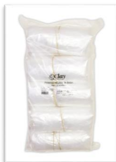
EMPAQUE PRIMARIO 10 ROLLOS X5 UNDS