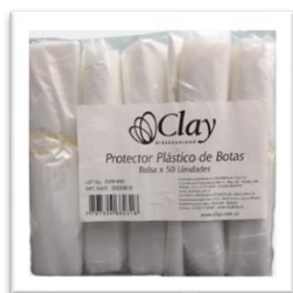
EMPAQUE PRIMARIO 5 ROLLOS X 10UNDS